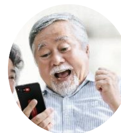
SwissvoiceC50s 使用者 (爸爸)